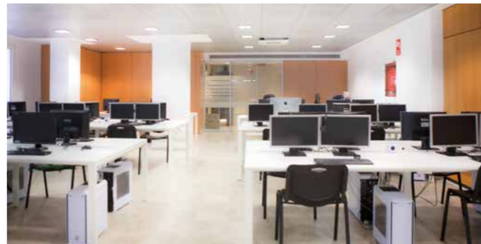
AULA DE INFORMÁTICA